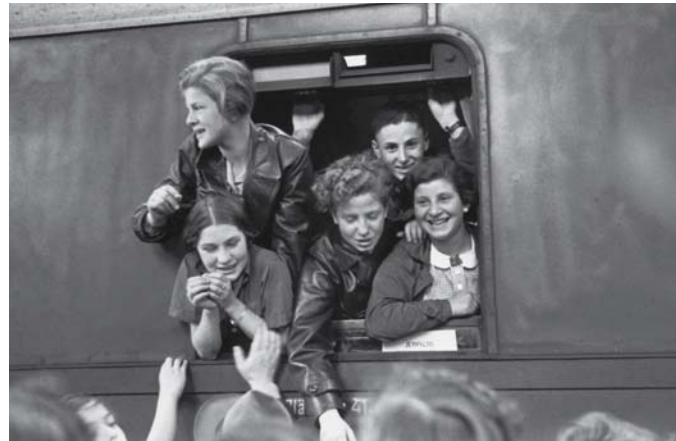
Jugendliche verabschieden sich am Anhalter Bahnhof in Berlin von ihren Familien, 1936, Jüdisches Museum Berlin